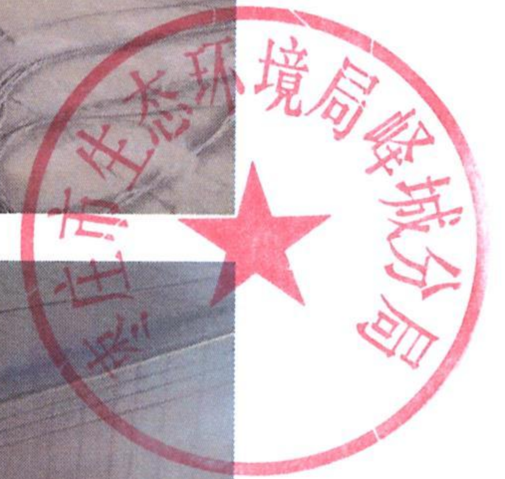
现场调查核实照片