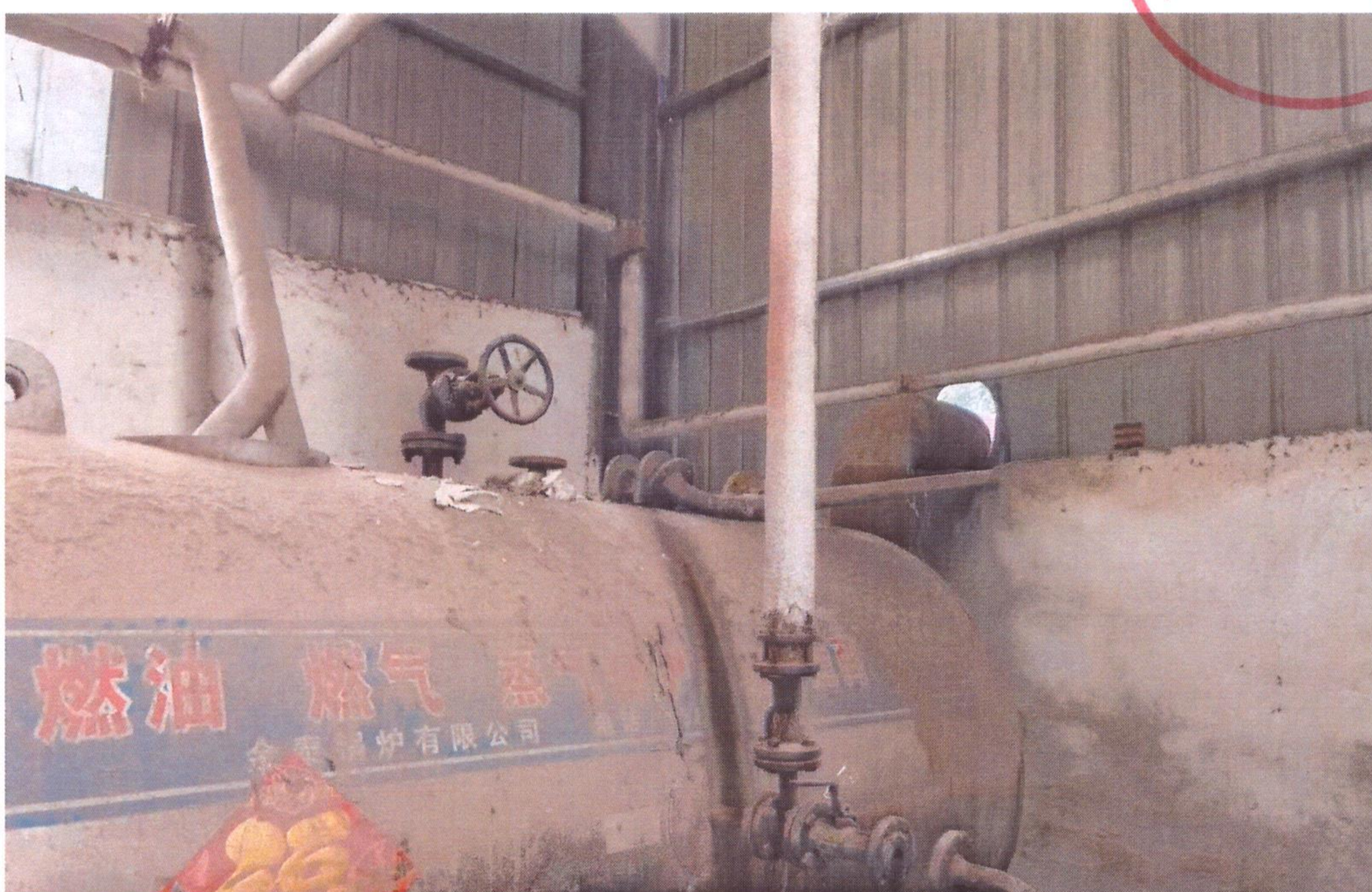
森奥木业拆除照片