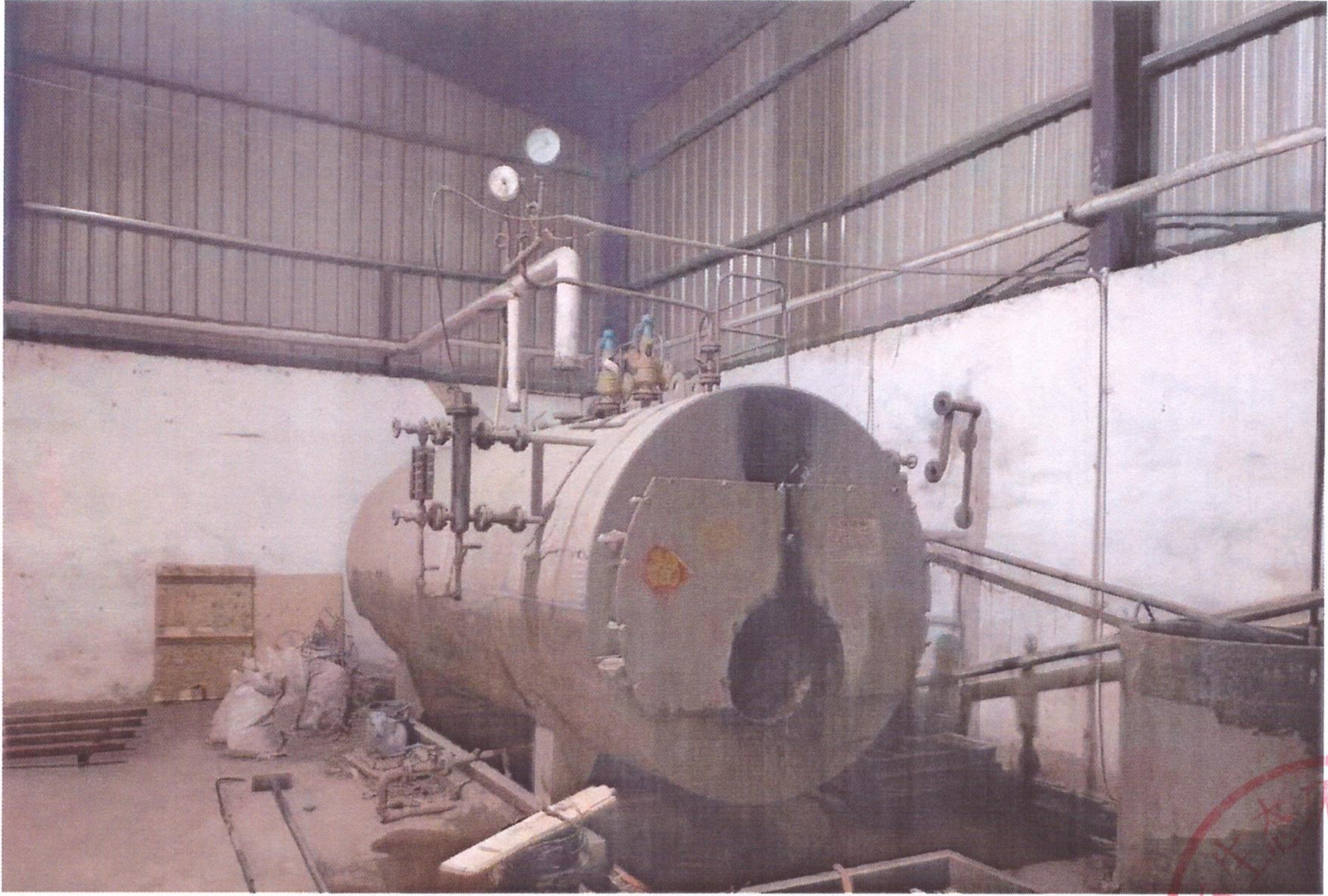
君奥木业拆除照片