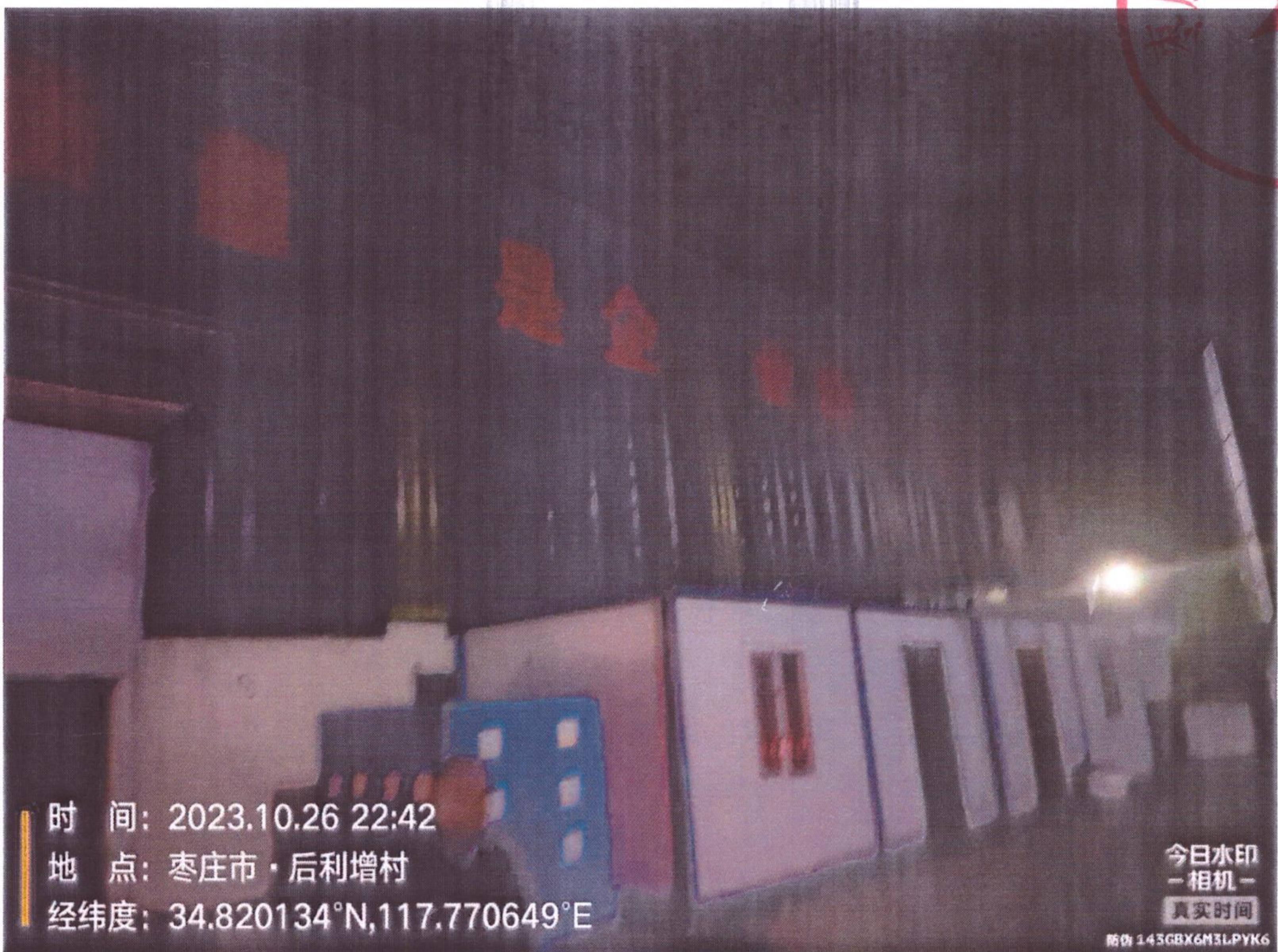
君奥木业现场照片