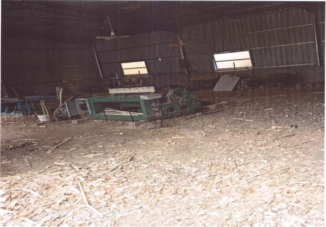
8、（孙守伟木材加工厂现场照片 2024. 1. 6）