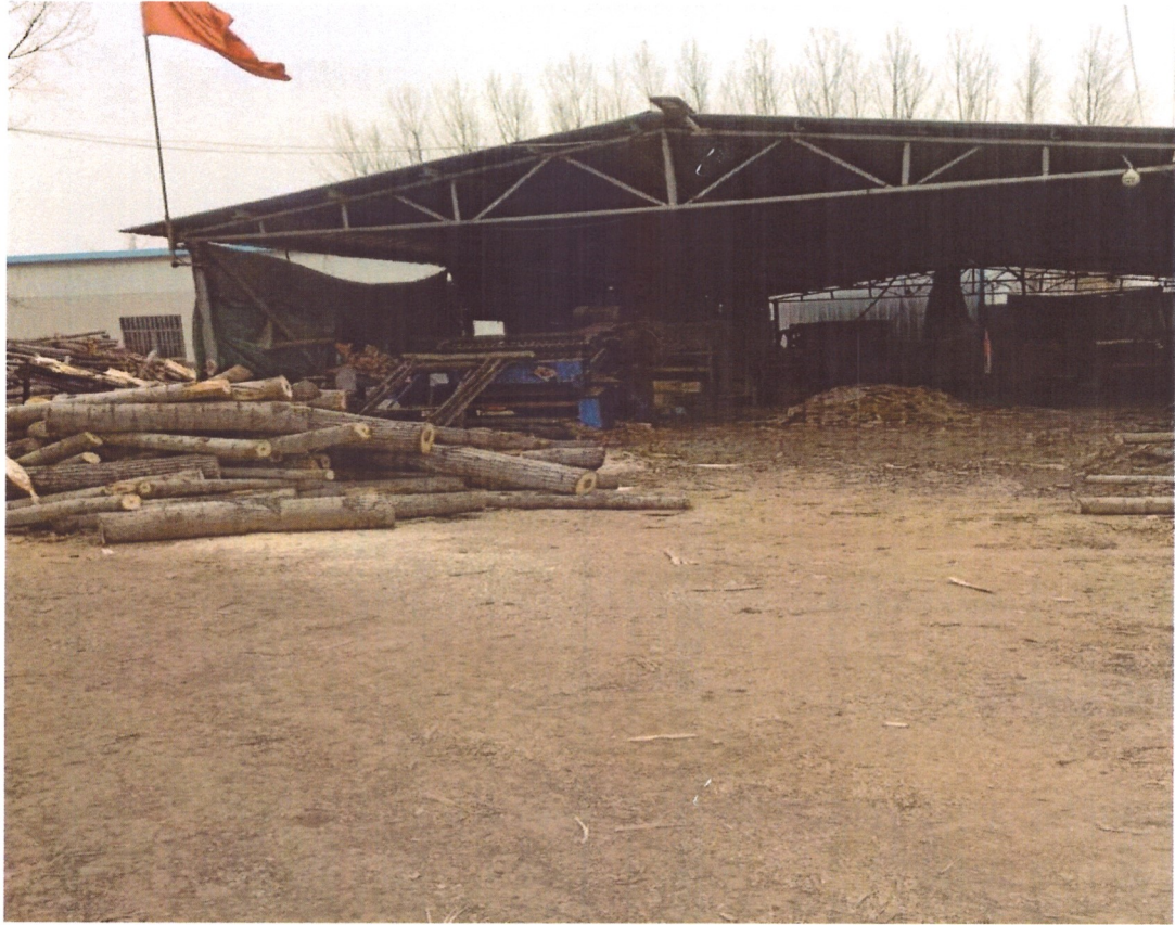
6、（孙守增木材加工厂现场照片 2024. 1. 6）